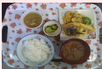
今月の厨房一押しメニュー 天ぷら盛り合わせ