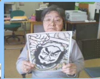
うまぐいったべが?