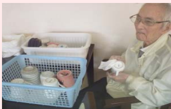
まだ、やってまったじゃ