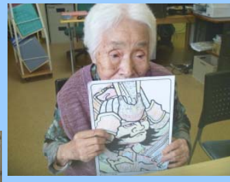
色合い、どうですか?