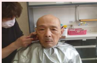
夏向きの髪型頼む