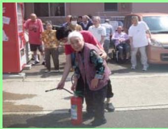
ここをこう持ちますよ