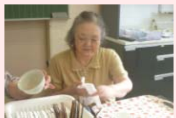
男性の仕事、 手際いいな