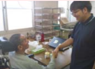
新入り,しっかりな。 「はいっ」