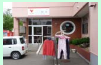
外干しを始めました