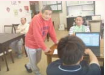
新入り,将棋やるべや。 「いやです」