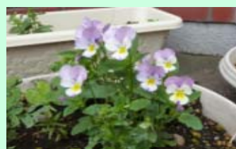
玄関前で癒されます